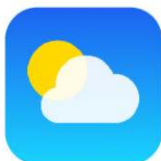
Ứng Dụng Thời Tiết

Ứng dụng đánh giá và đặt chỗ nhà hàng giúp bạn tìm các lựa chọn ăn uống, đọc đánh giá và đặt chỗ.