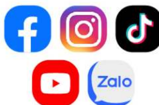
Phương Tiện Truyền Thông Xã Hội

Các ứng dụng như AccuWeather hoặc Weather.com có thể cung cấp dự báo thời tiết cập nhật để giúp bạn lập kế hoạch cho các hoạt động của mình.