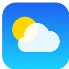
Ứng Dụng Thời Tiết

Ứng dụng đánh giá và đặt chỗ nhà hàng giúp bạn tìm các lựa chọn ăn uống, đọc đánh giá và đặt chỗ.